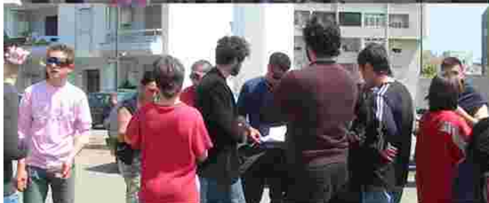
Fase di ascolto. Riunioni e discussioni