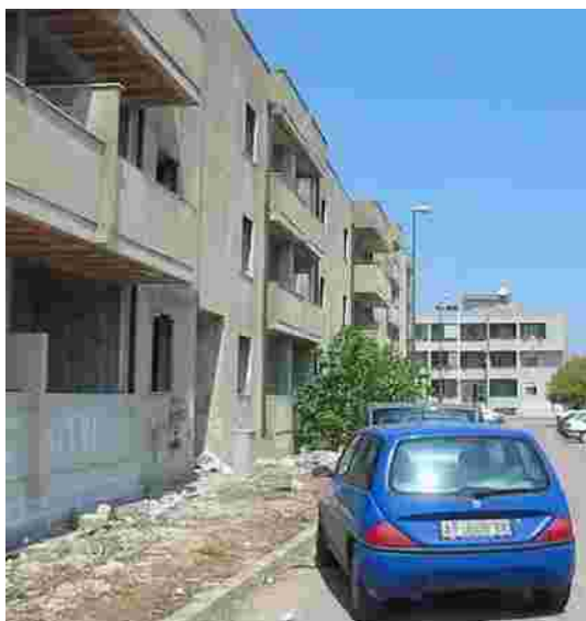
Zona 167 Tricase. Stecca abbandonata