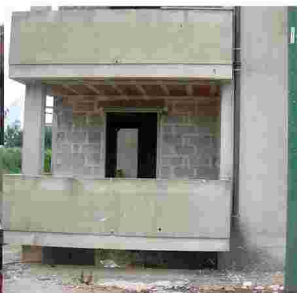
Appartamento destinato al laboratorio