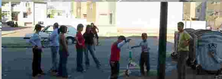
Prime avvicinamento agli abitanti del quartiere