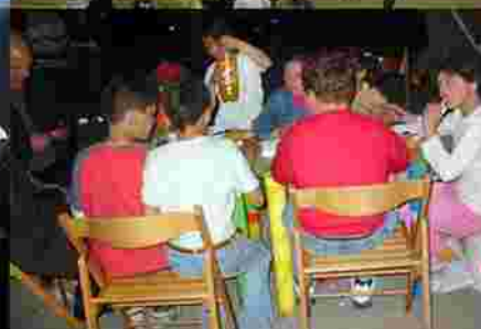
Allestimento laboratorio e attivazione dei lavori: disegno, mappatura della zona, giornalismo, fotografia