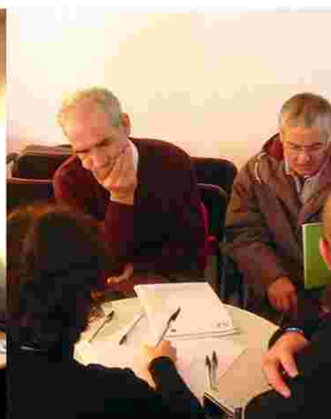
Attivazione dei gruppi di discussione