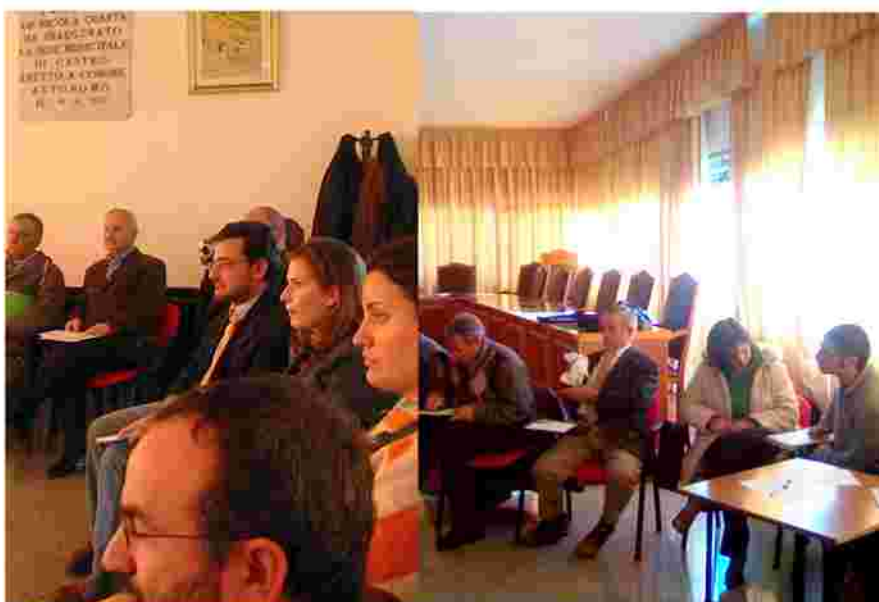
Fase di ascolto