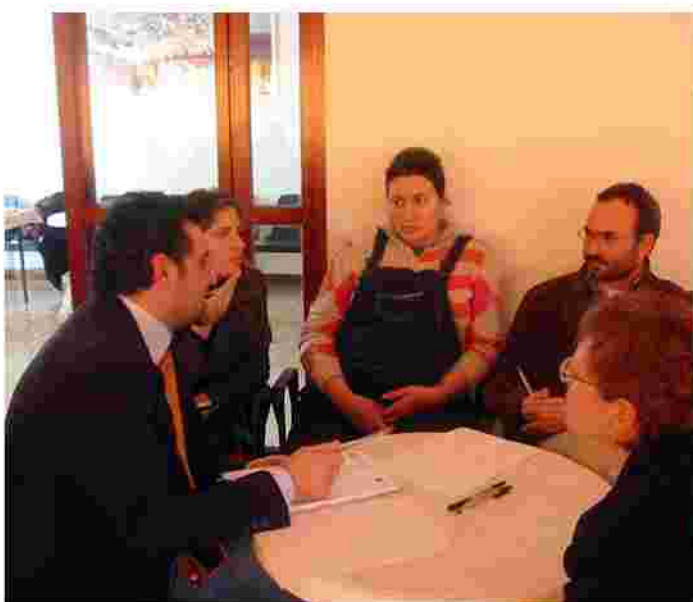
Attivazione dei gruppi di discussione