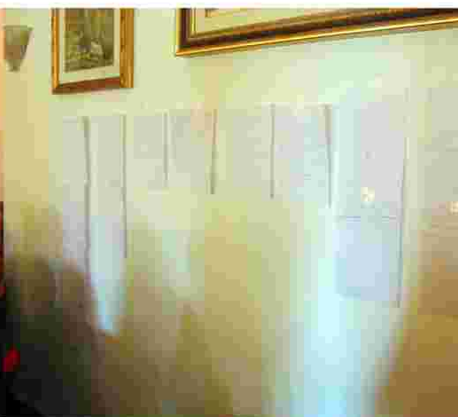
Letture ed elaborazione dei temi e dei sottotemi